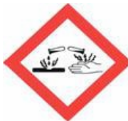
PICTOGRAMME SGH DANGER